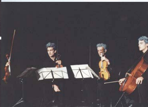
- Mère de guerre, mère et fils , spectacle qui a eu lieu à Cracovie en 2004 - Mère de guerre , projet d'affiche pour le spectacle de novembre 2005