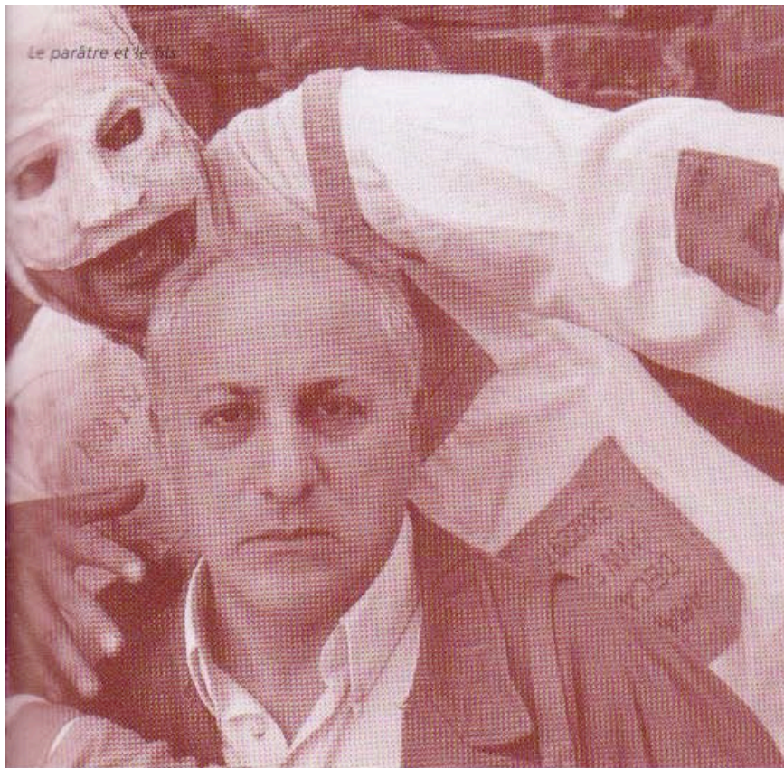
Le parâtre et le fils