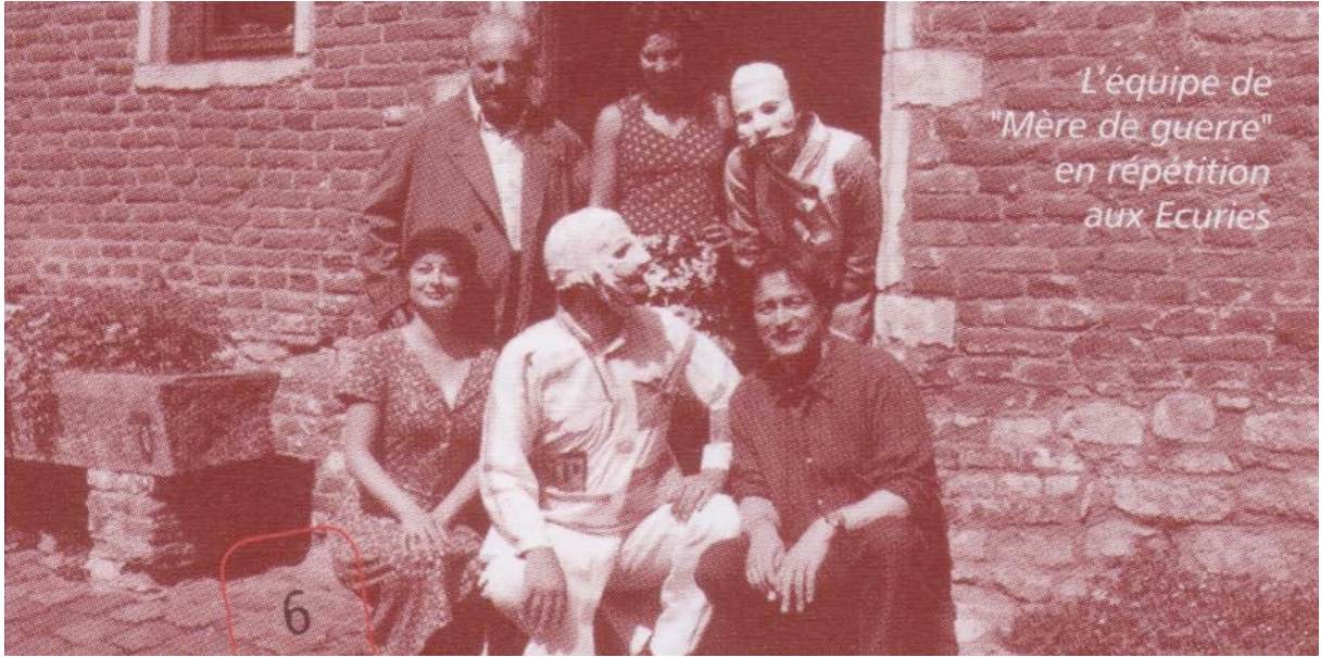
L'équipe de "Mère de guerre" en répétition aux Ecuries